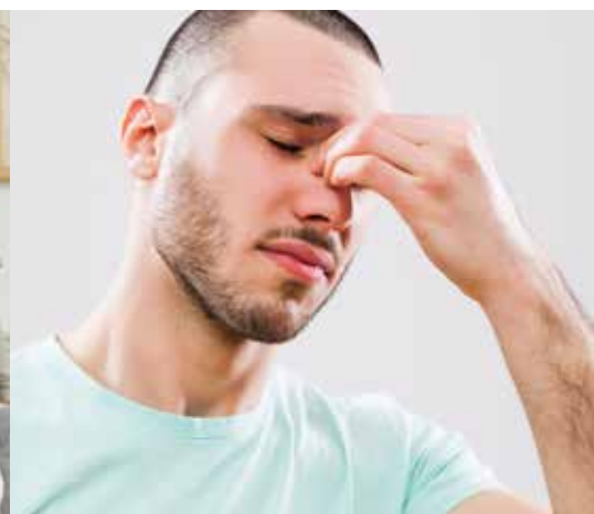
DUFTALLERGI / KEMISK INTOLERANS (MCS)