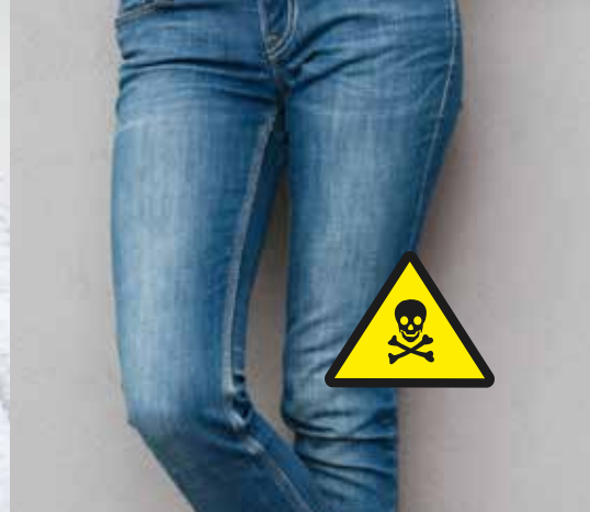
KEMI I TEKSTILER

OdorKlenz Laundry Additive anvendes med succes til utallige opgaver